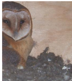
Originalbild aus dem Eulen-kasten im alten Trafo-häuschen am Marienplatz

Und nun gibt es Gutes zu berichten: Es hat sich ein Schleiereulenpaar angesiedelt und 3 Junge großgezogen. Wieder ein kleiner Beitrag zur Verbesserung der Lebensräume von einheimischen Vögeln.